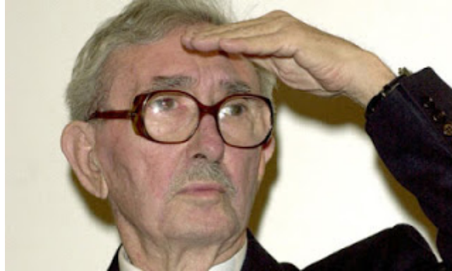
Luciano Emmer, primo presidente di Giuria

Dodici anni, forse qualcuno in più (diremo poi meglio di questa incertezza anagrafica). Abbastanza, o troppo pochi, per raccontare gli albori del Festival del Cinema Indipendente di Foggia, come si trattasse di un pezzo della storia culturale della Capitanata?