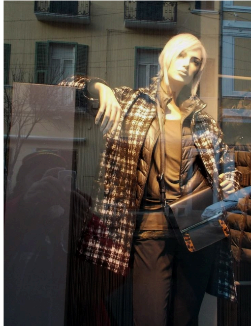
a ri-RIFLESSelfie ... (M.Sepalone)

Veramente interessante la discussione che si è aperta sulla lettera meridiana Foggia e la memoria oltraggiata: il castello (dimenticato) di Ponte Albanito nella quale commentavo la cattiveria con cui l'insigne storico Romolo Caggese ha raccontato il capoluogo danno nel suo libro Foggia e la Capitanata .