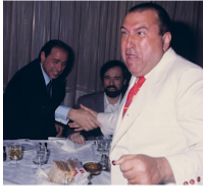
Jimmy il Fenomeno

Gallo, in America, fu uno dei più grandi impresari in campo operistico. Suo anche il primo film sonoro (del 1929) dedicato ad un'opera completa, "I Pagliacci" di Leoncavallo.