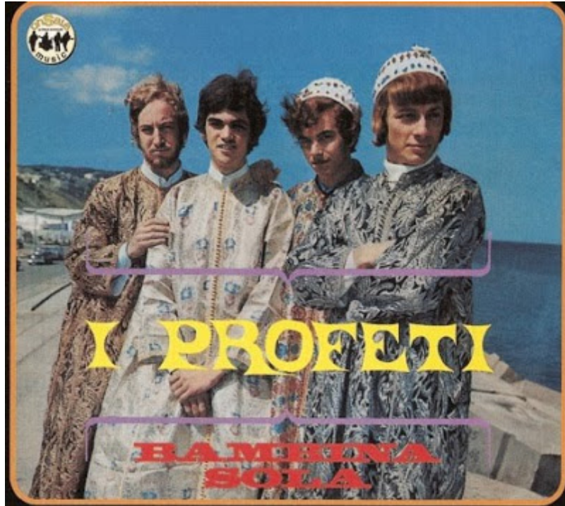
Il complesso dei Profeti: pochi sanno che erano quasi tutti foggiani