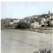
• Com'era il Gargano un