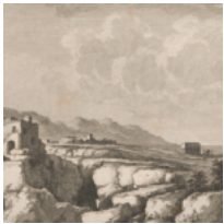
• La Capitanata struggente dell'abate De Saint-Non