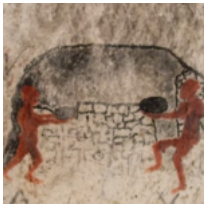
• Scoperte moderne pitture rupestri sul Gargano: quanto sono belle!