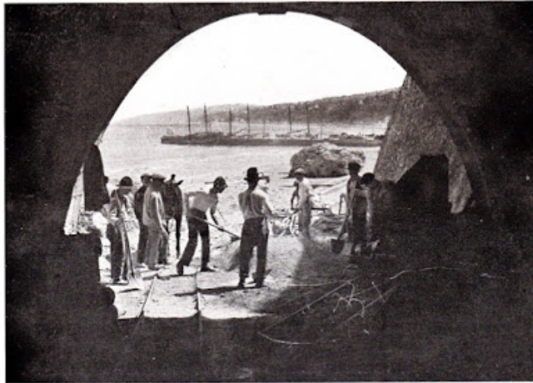
Sbocco della galleria nel porto di Rodi garganico.