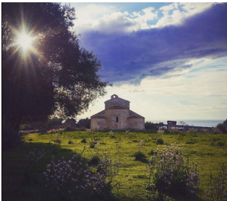
Santa Maria di Devia

Una mail per salvare Santa Maria di Devia , l'antica chiesa romanica dal ciclo di affreschi bizantineggianti situata sul Monte D'Elio, in mezzo ai laghi di Lesina e Varano e di fronte alle Isole Tremiti, in un angolo meraviglioso e a tratti incontaminato del comune di San Nicandro Garganico.