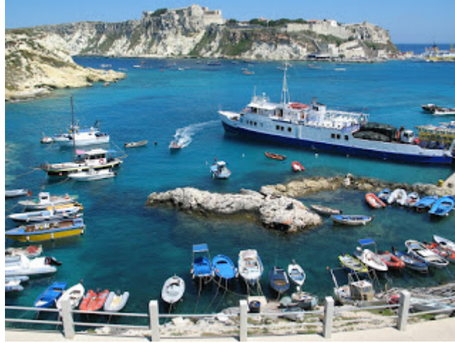
Il porticciolo delle Isole Tremiti