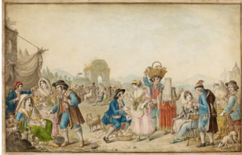
La Fiera di Foggia nel 1777, in un acquerello di Luigi Del Giudice

Il pezzo di Geppe Inserra sulla Fiera di Foggia come una inaspettata risorsa intelligente per la città di Foggia, ma anche nei confronti dell'intero territorio, mi riporta immediatamente ai casi di tante città, che, di fronte alla loro crisi di ingolfamento o di mancato nuovo sviluppo, utilizzano le "aree dismesse" come polmoni in cerca di nuovo ossigeno. Ovvero di ribaltamento delle situazioni stallate.