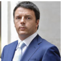
• L'assordante silenzio dei cattolici del Pd (e del loro Gran Mogol)