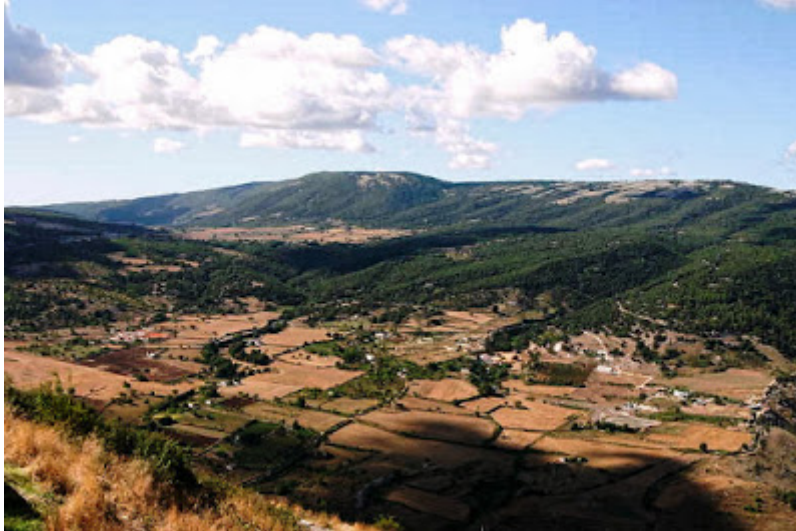
La Valle Carbonara