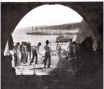
Stacco della galleria nel grotto di Rocca garganica.

• Gargano, devastato il parco archeologico ambientale di Devia