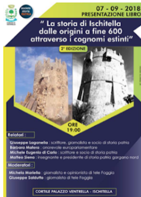
La locandina dell'evento

Seguendo un ordine cronologico, al fine di ricostruire la storia del feudo di Ischitella, Pasquale Corsi, già presidente della Società di Storia Patria per la Puglia, prende in somma considerazione la monografia di padre Ciro Cannarozzi [3], dove sono rinvenibili rilevanti testimonianze estratte dall'Archivio di Stato di Napoli, prima che i documenti attinenti fossero distrutti durante la seconda guerra mondiale. Dall'ampia documentazione studiata, Corsi rileva in un atto notarile rogato a Vieste nel 1153, l'esistenza di un Gionata, qualificatosi come "signore di Ischitella" e probabile esponente di un ramo marginale dell'aristocrazia normanna; invece, nell' "Historia" di Huillard-Brebolles Corsi ravvisa, in un privilegio di Federico II del 1225, la presenza di un non meglio precisato Paolo, "dominus" dell'insediamento fortificato di Ischitella, mentre nel "Catalogus baronum" , curato dal Cuozzo, annovera come signora di Ischitella la famosa - perché celebrata nei teatri del Novecento - "Syfridina" , contessa di Caserta [4].