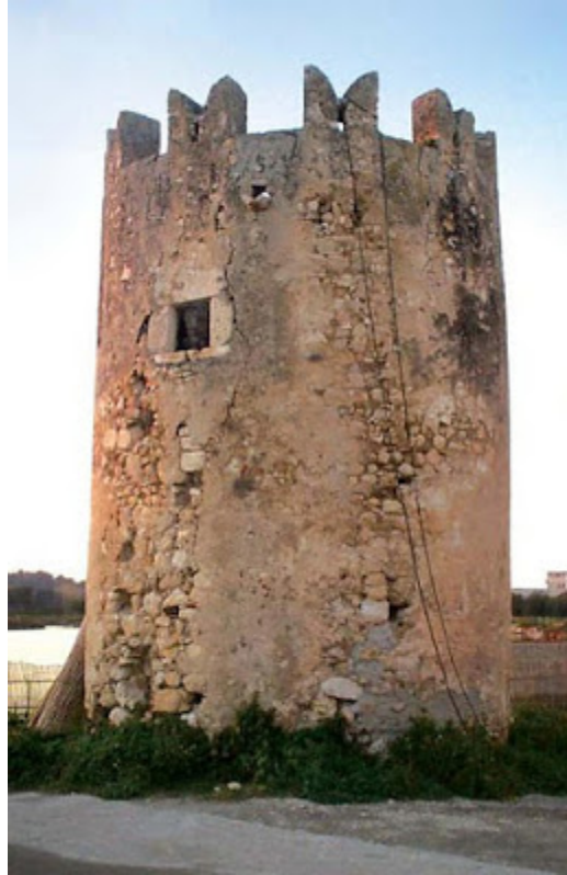
La torre di Varano