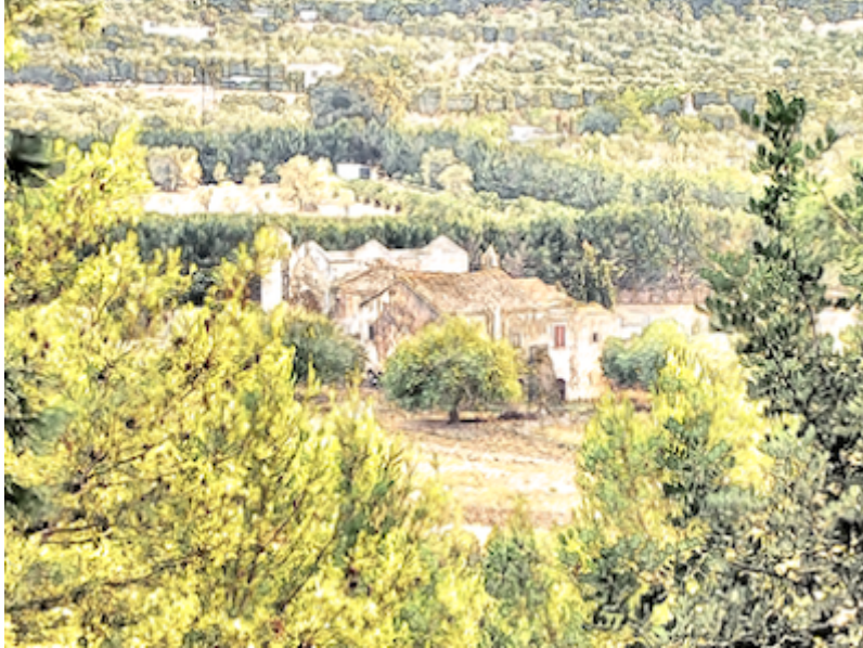
L'Abbazia di Kalena

Oggi la festa delle Madonne di Kalena e di Ripalta: in regalo acquerelli e immagini d'arte digitale