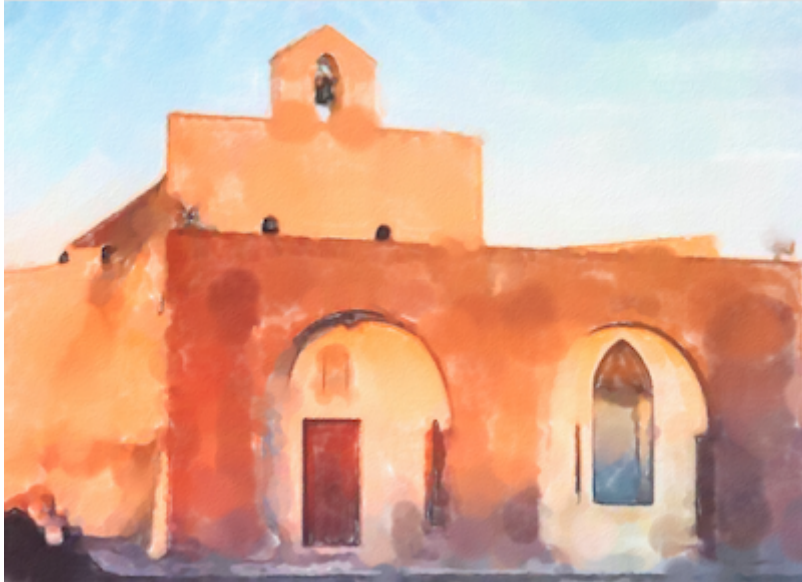
L'acquerello della Chiesa della Madonna di Ripalta (Cerignola)

Anche i fedeli di Cerignola s'inclinano oggi ai piedi della loro patrona, la Madonna di Ripalta, la cui icona, secondo la leggenda, venne ritrovata sulle rive dell'Ofanto. Ignari del valore spirituale ed artistico del quadro, quelli che l'avevano trovato lo utilizzarono per battervi il lardo o secondo un'altra versione per farne legna da ardere. A quel punto dal legno sgorgò del sangue e si gridò al miracolo. Nel luogo del rinvenimento venne costruito un tempio (o più precisamente si riadattò un edificio adibito in precedenza a culti pagani), che è quello che potete scaricare, in versione acquerellata.