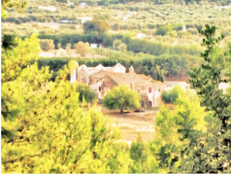
L'acquerello dell'Abbazia di Kalena (Peschici)

Come avevamo promesso, la collezione di acquerelli e foto d'arte che Lettere Meridiane sta regalando per festeggiare i 7.000 iscritti alla pagina facebook del blog, si occupa oggi delle Madonne che vengono festeggiate in Capitanata l'8 settembre, giornata in cui la Chiesa celebra la Natività della Vergine Maria: la Madonna di Kalena a Peschici e la Madonna di Ripalta, a Cerignola.