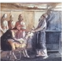
Capri espiatori (di Marcello Colopi)