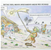
Gli auguri di Natale di Riso alla Foggiana